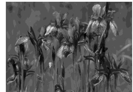
Sibirische Schwertlilie – typische Reusstalpflanze