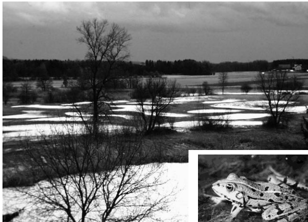
Stille Reuss mit winterlicher Tümpellandschaft

Die Reussebene ab Maschwanden/Mühlau bis Bremgarten gilt als eine der besterhaltenen Ried- und Auenlandschaften des Mittellandes. Verschiedene Meliorationen haben den Reusslauf hier zwar eingedämmt und grosse Gebiete entwässert, trotzdem sind relativ viele naturnahe Lebensräume erhalten geblieben, die heute durch Naturschutzzonen gesichert sind - im Aargauer Gebiet sind es rund 3 km 2 , im Zürcher/Zuger-Teil rund 2 km 2 . Ein Mosaik aus vielfältigen Biotopen beherbergt eine Fülle von seltenen und bedrohten, feuchtgebietstypischen Tieren und Pflanzen. Die farbenprächtigen Iriswiesen sind für die Schweiz einzigartig. So sind Spezialisten wie der Flussregenpfeifer, der Kamm- oder Teichmolch und die Zierliche Moosjungfer auf solche Lebensräume angewiesen. Bauboom, zunehmender Strassenverkehr, steigender Druck von Erholungssuchenden und intensive Landwirtschaft führen aber zu zahlreichen Konflikten.