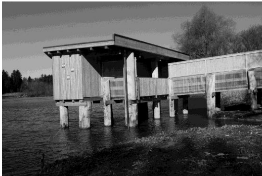
In der Beobachtungshütte (Hide) am Flachsee lassen sich Wasservögel ideal beobachten.

Für eine interessante und vielfältige Führung sollte mindestens ca. 2 Stunden einberechnet werden.