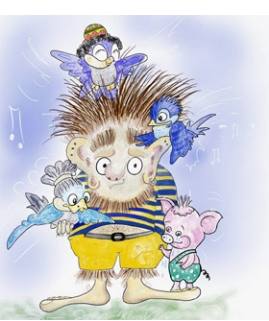
Zeichnung: Esther Sorg

Leitung: Stefan Sprenger, Autor von Chnorrlimorri Treffpunkt: Zieglerhaus, Hauptstrasse 8, 8919 Rottenschwil (bitte öffentlichen Parkplatz an der Reussbrücke benutzen) Beginn: 14.00 Uhr, Ende: ca. 16.00 Uhr Kosten: Erwachsene CHF 15.–, Kinder bis 16 Jahre gratis Anmeldung bis am Vortag um 17 Uhr unter www.stiftung-reusstal.ch/anmeldung Hinweis: Die Bücher «Chnorrlimorri» und «Chnorrlimorri 2» können gekauft werden